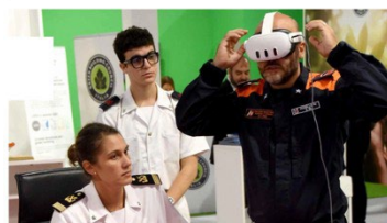
Tra gli innumerevoli stand, anche quello dell'Aeronautica militare (BP)

Inaugurata ieri la diciottesima edizione di RemTech Expo, fiera dedicata ai settori tecnologia e ambiente che fino a domani, con oltre 350 stand, sarà luogo di condivisione e di cooperazione sulle policy dell'agenda politica nazionale ed internazionale, in cui esperti, decision maker, imprenditori e professionisti del settore discuteranno le sfide del terzo millennio. A prendere parte al taglio del nastro è stato il ministro all'Ambiente Gilberto Pichetto Fratin, oltre ad Alessandro Morelli, sottosegretario alla presidenza del Consiglio dei ministri, Jacopo Morrone, presidente della commissione bicamerale